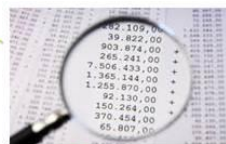
CONTROLLI DELL'AMMINISTRAZIONE FINANZIARIA

(in caso di accertata mancata integrazione, anche parziale, dei requisiti oggettivi che danno diritto alla detrazione d'imposta)